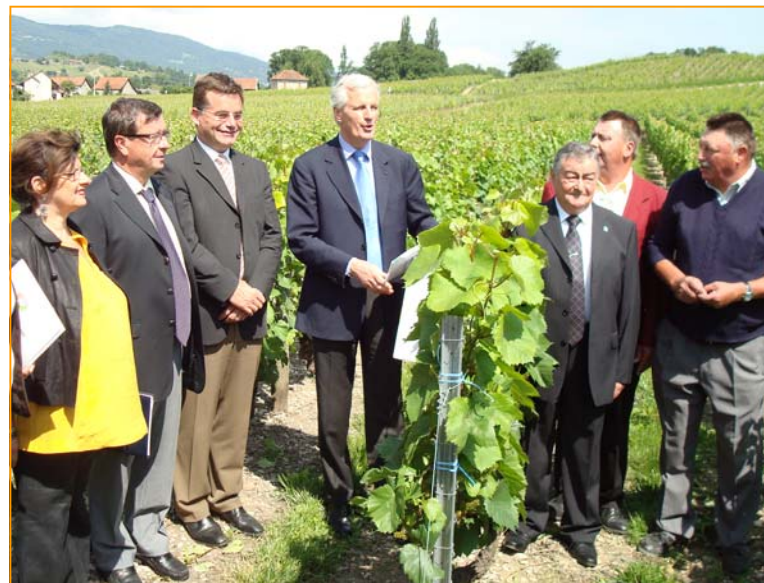
14 Juin 2008 Signature de la Charte des Bonnes pratiques viticoles en présence du Ministre de l'Agriculture Michel Barnier . Les Marches

Réalisation Chambre d'Agriculture de Savoie Communication Nov. 2008